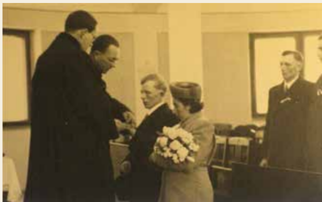
Svatba 1941, Konfirmace 1940 a 1941.