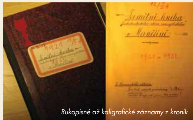
Rukopisné až kaligrafické záznamy z kronik