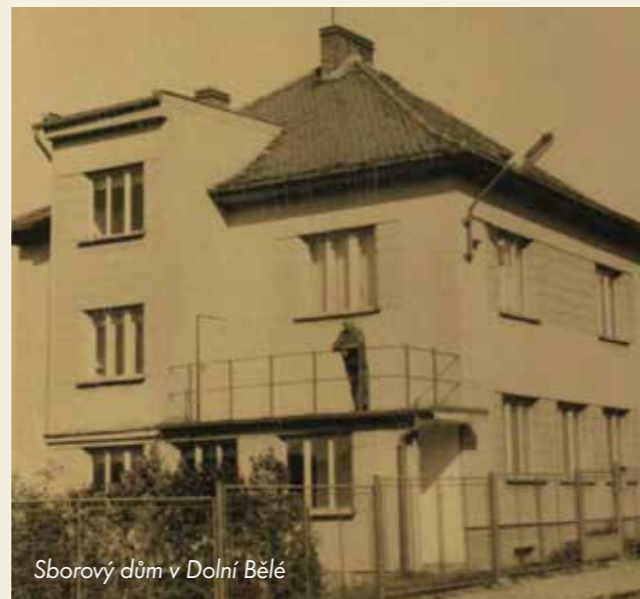
Sborový dům v Dolní Bělé