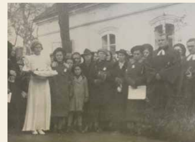
Fotografie z průběhu slavnosti